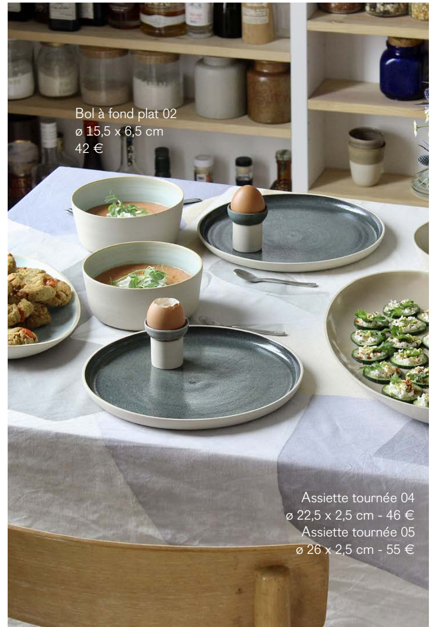
Bol à fond plat 02 ø 15,5 x 6,5 cm 42 €