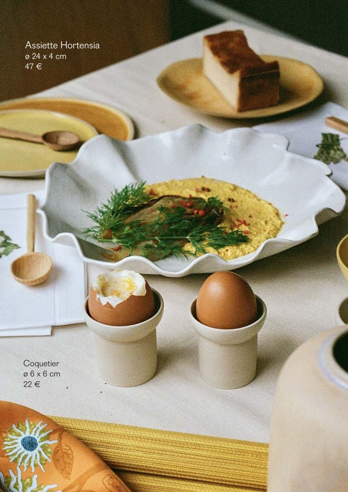
Coquetier ø 6 x 6 cm 22 €