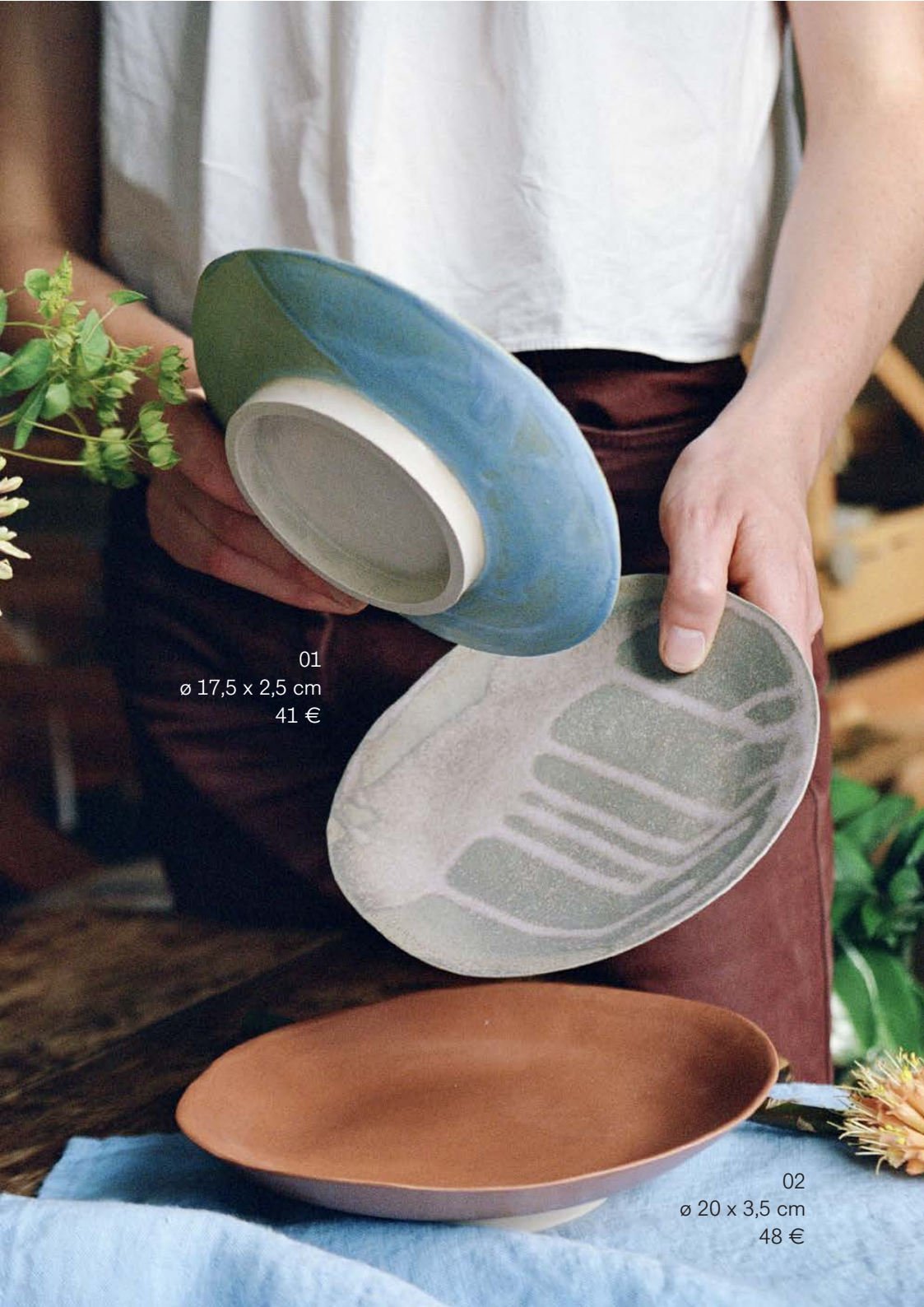
01 ø 17,5 x 2,5 cm 41 €