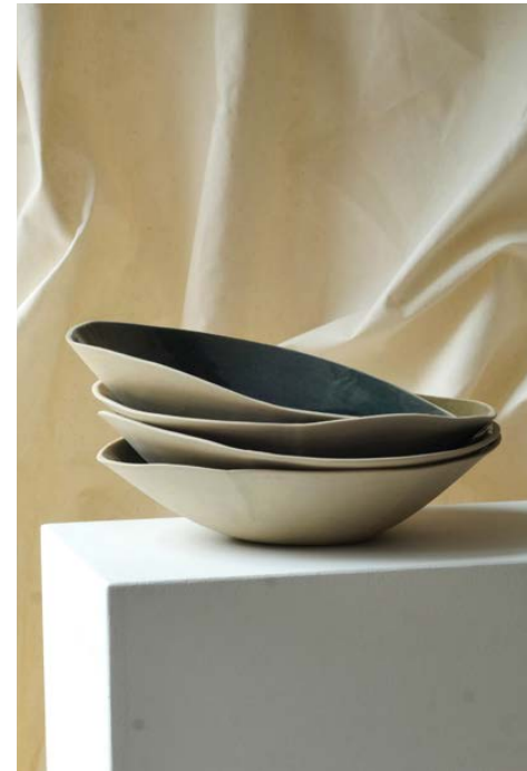
Coupelle estampé 02 ø 21 x 4,5 cm 42 €