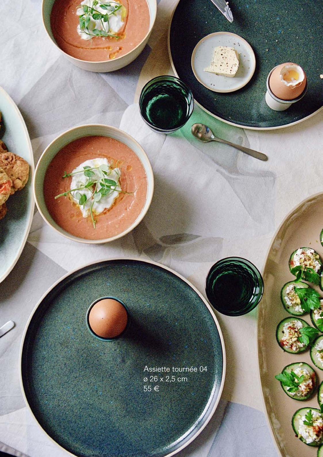
Assiette tournée 04 ø 26 x 2,5 cm 55 €