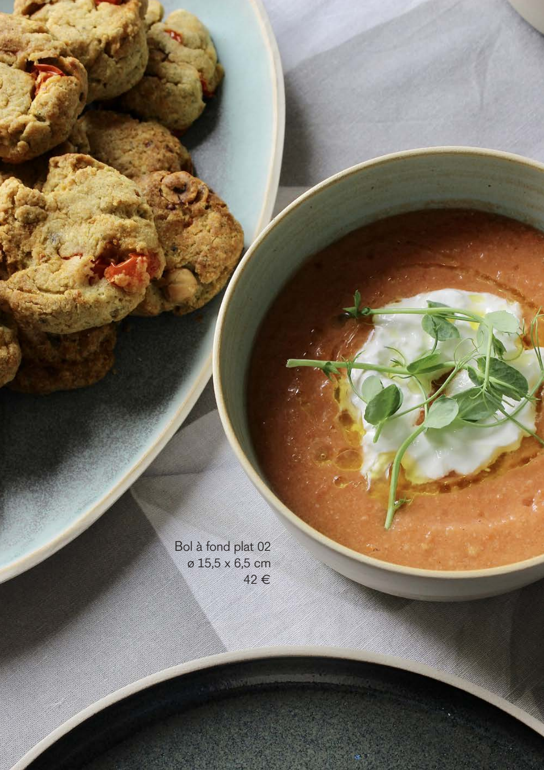
Bol à fond plat 02 ø 15,5 x 6,5 cm 42 €