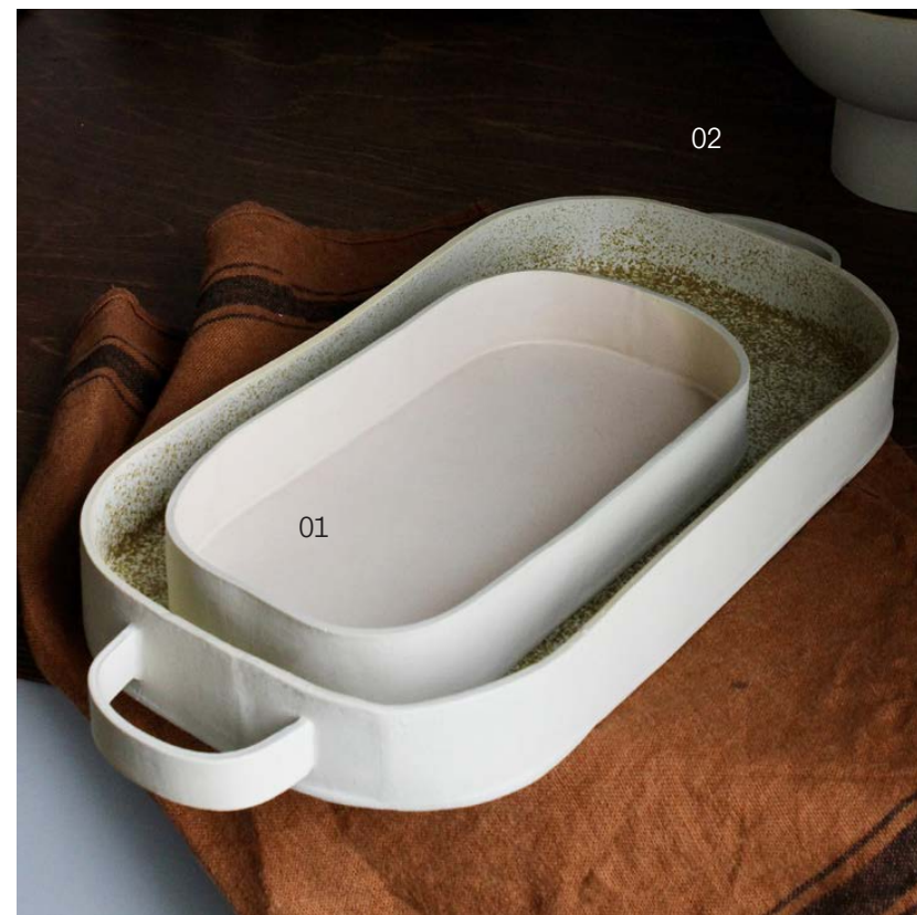
01 13,5 x 26 x 3,5 cm 80 €