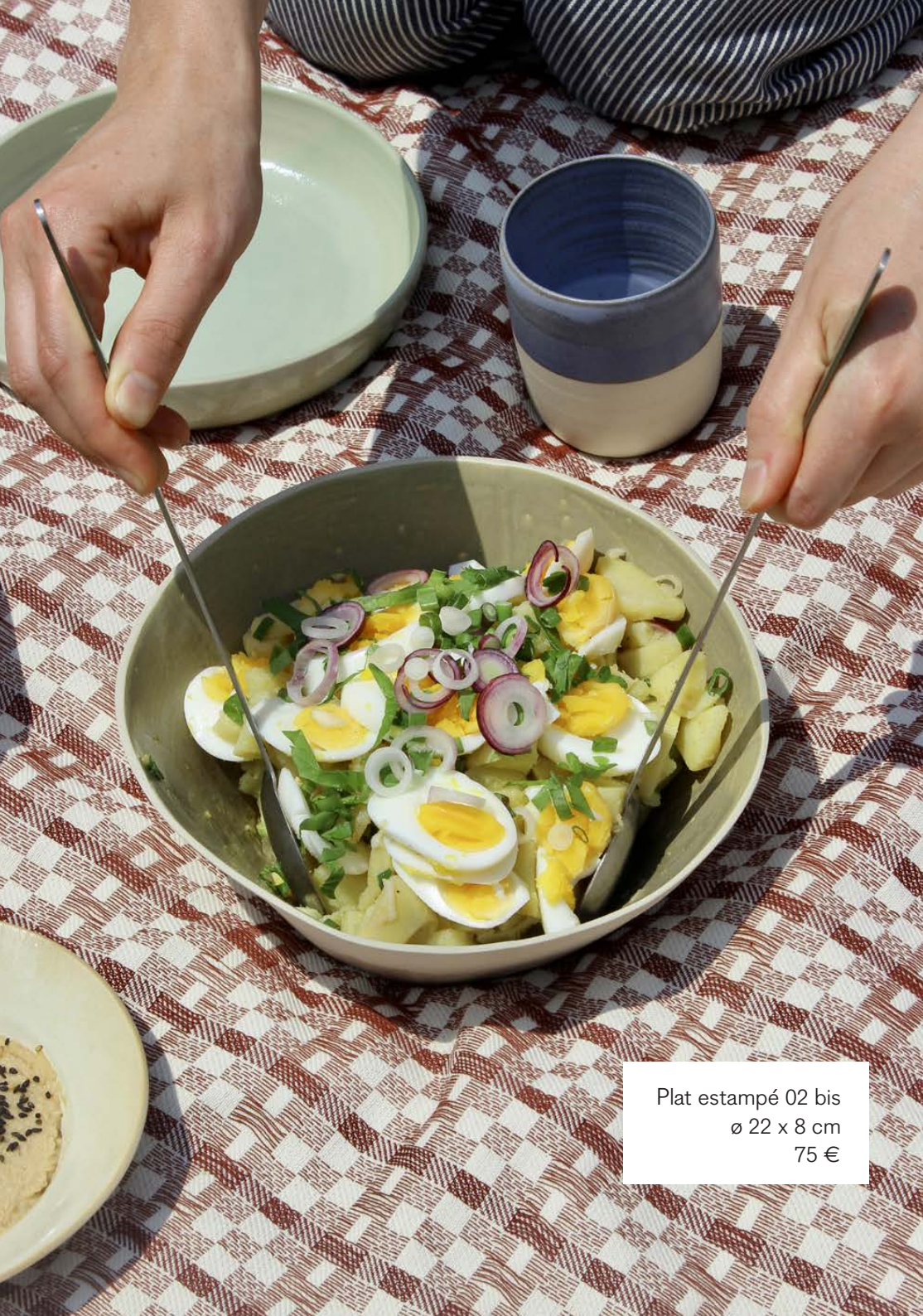
Plat estampé 02 bis ø 22 x 8 cm 75 €