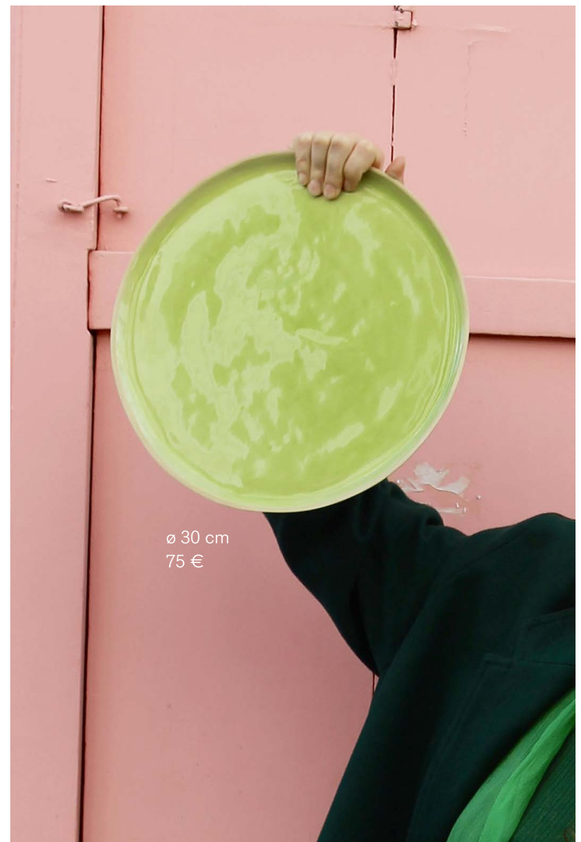
ø 30 cm 75 €