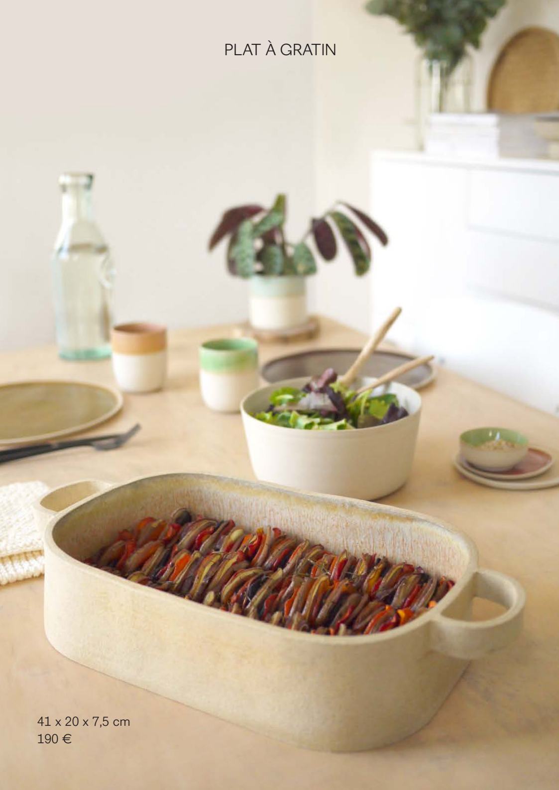
PLAT À GRATIN