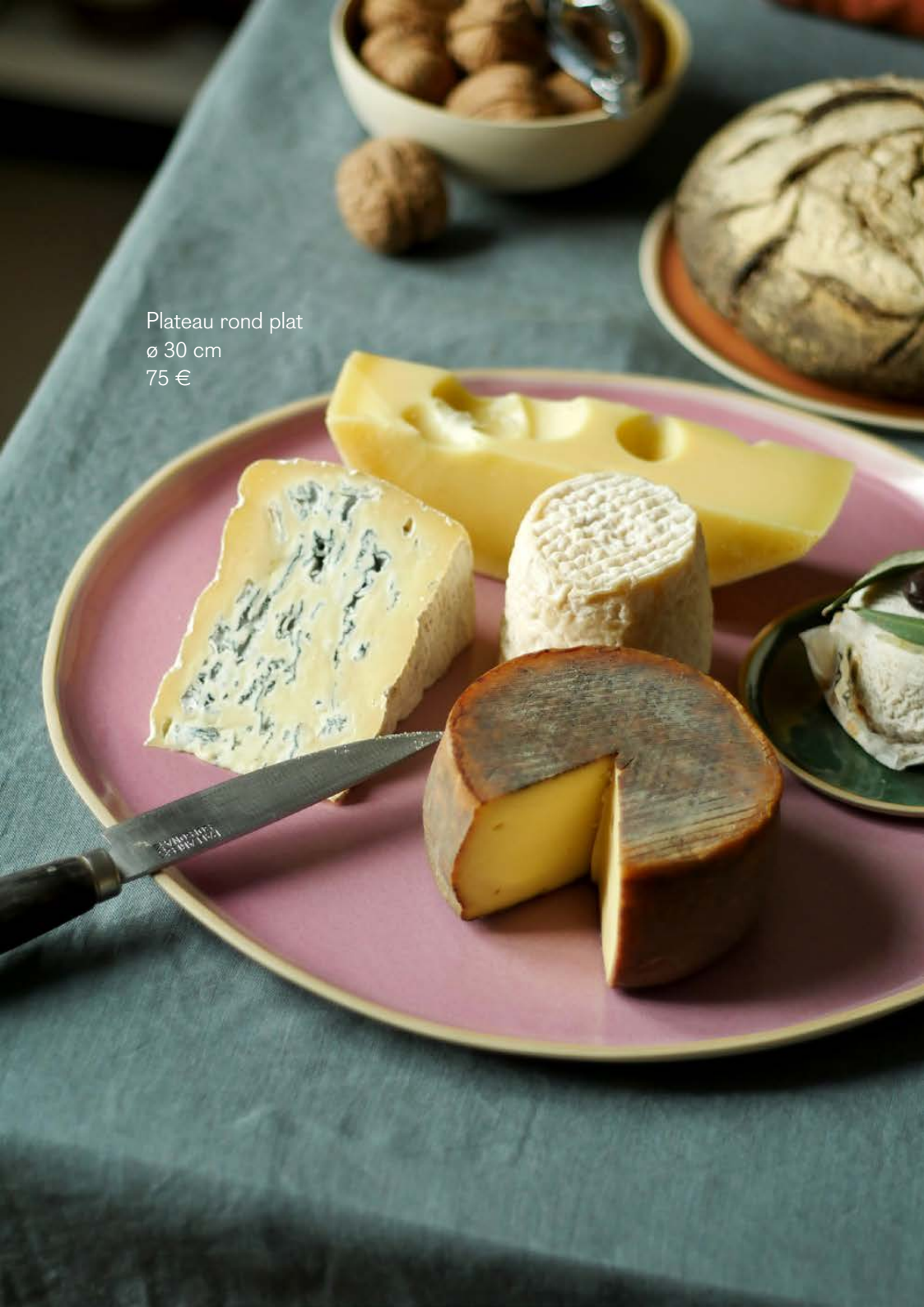
Plateau rond plat ø 30 cm 75 €