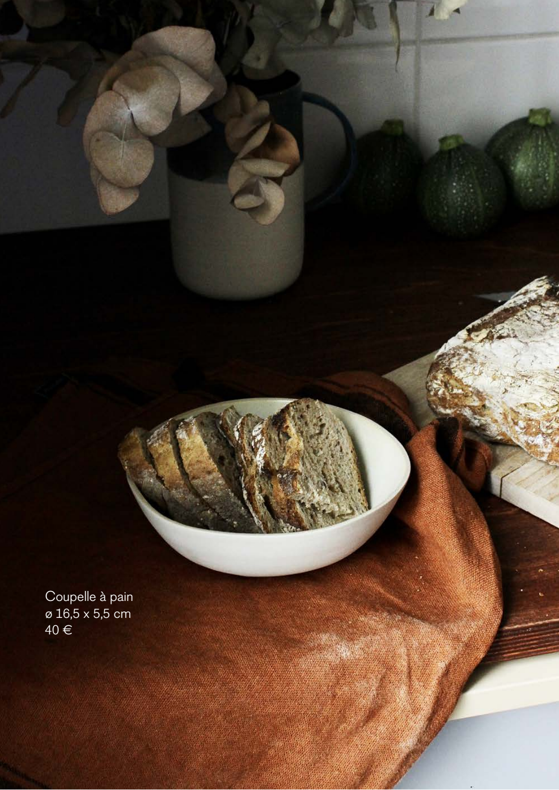
Coupelle à pain ø 16,5 x 5,5 cm 40 €