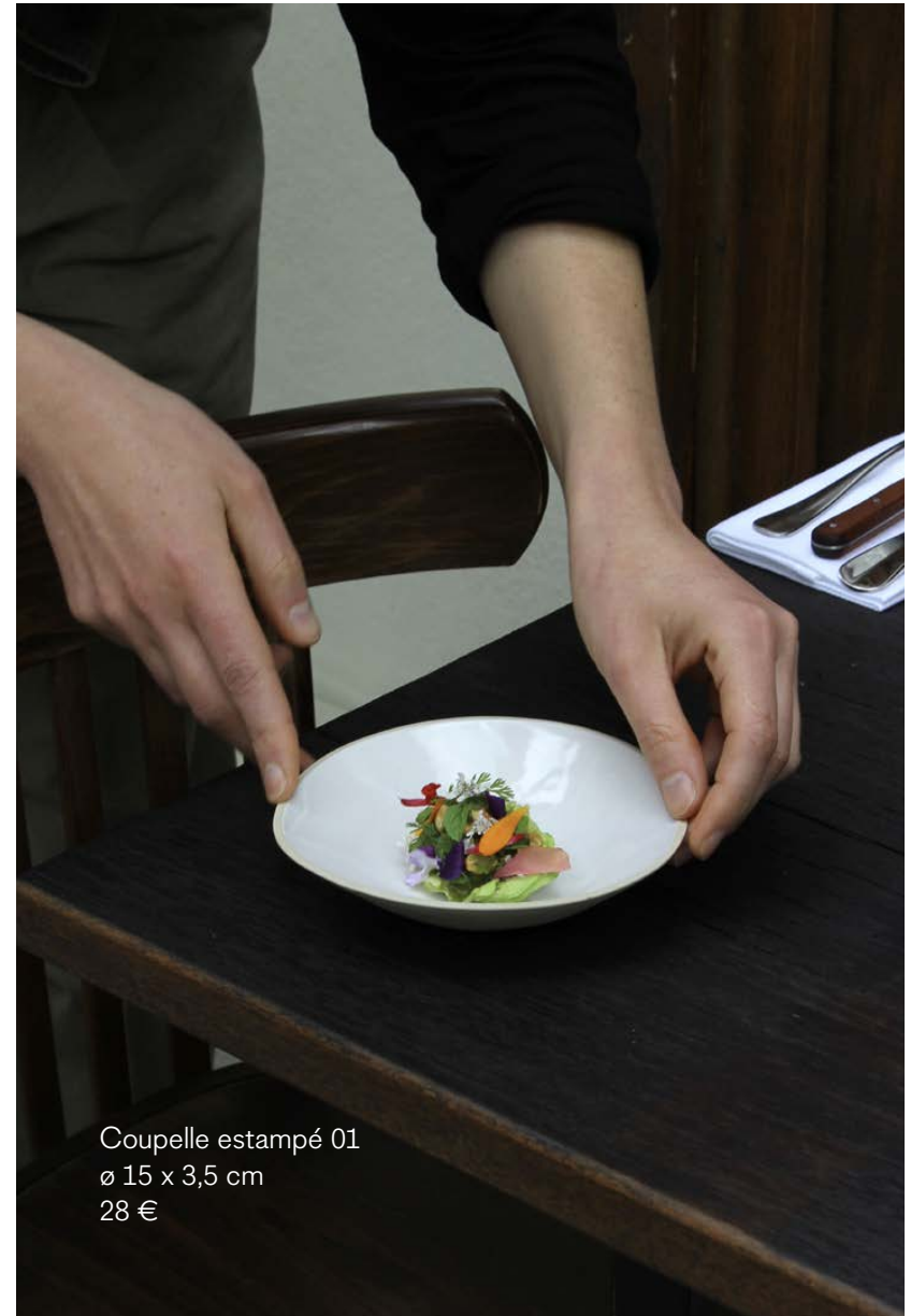
Coupelle estampé 01 ø 15 x 3,5 cm 28 €