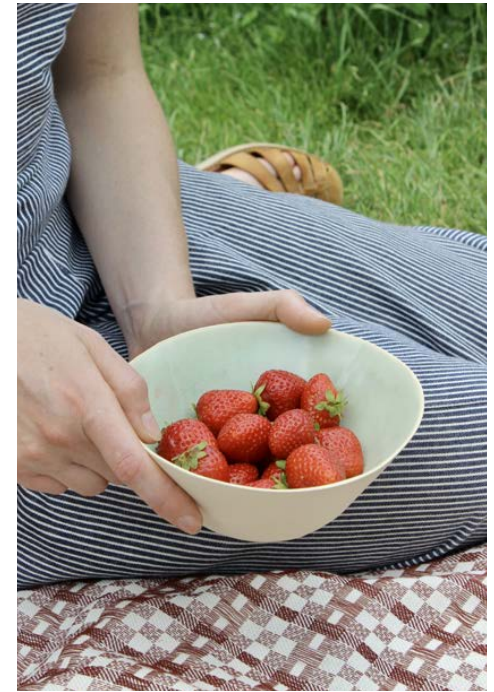
Plat estampé 01 ø 16,5 x 6,5 cm 40 €