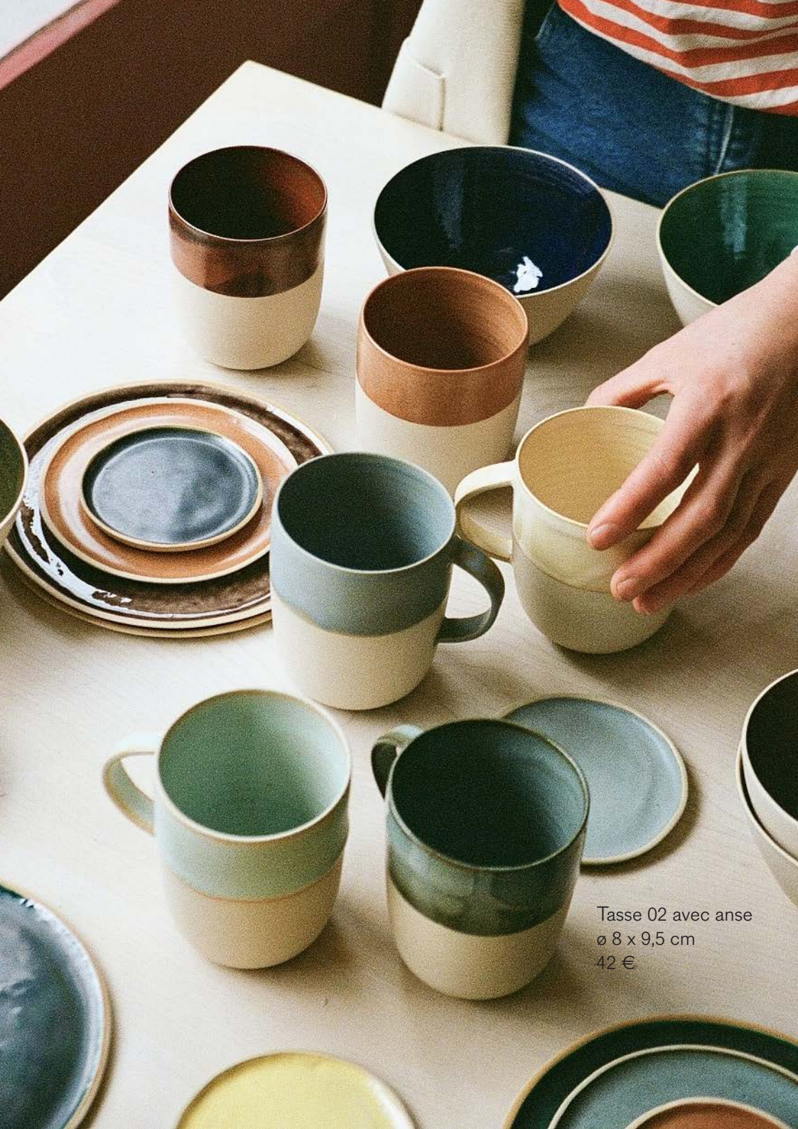
Tasse 02 avec anse ø 8 x 9,5 cm 42 €