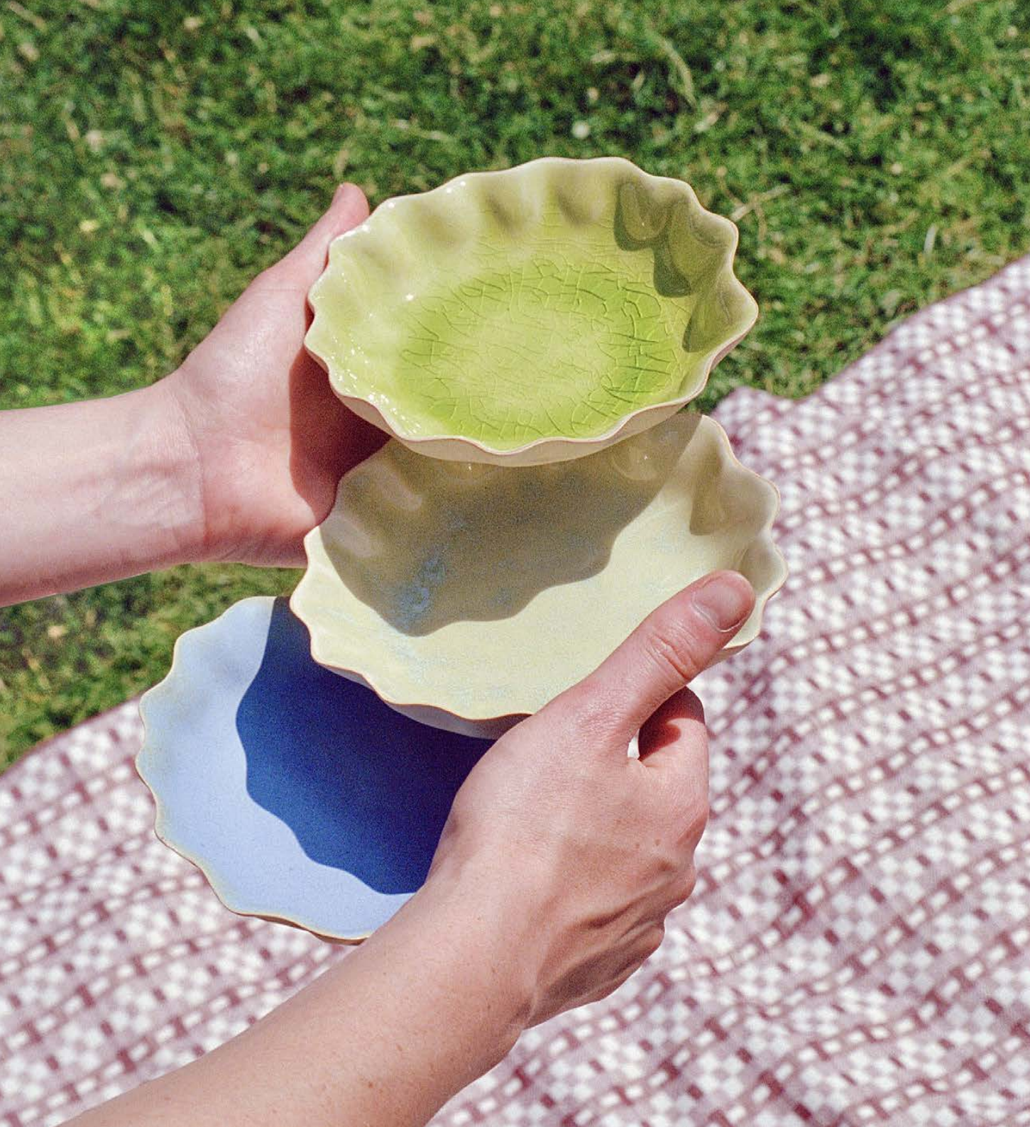
Assiette Corolle ø 15 x 3,5 cm 44 €