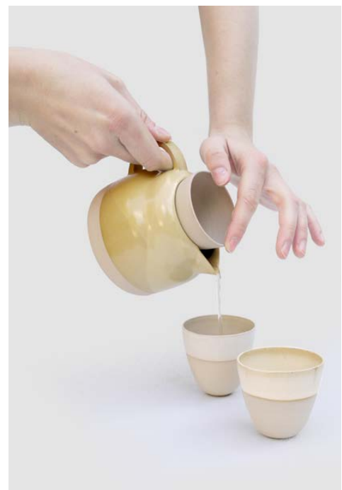
Théière Nueuse 01 ø 11 x 8,5 cm 130 €