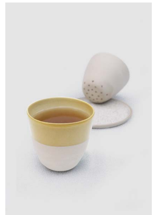
Tasse Nueuse 01 ø 7 x 7 cm 24 €