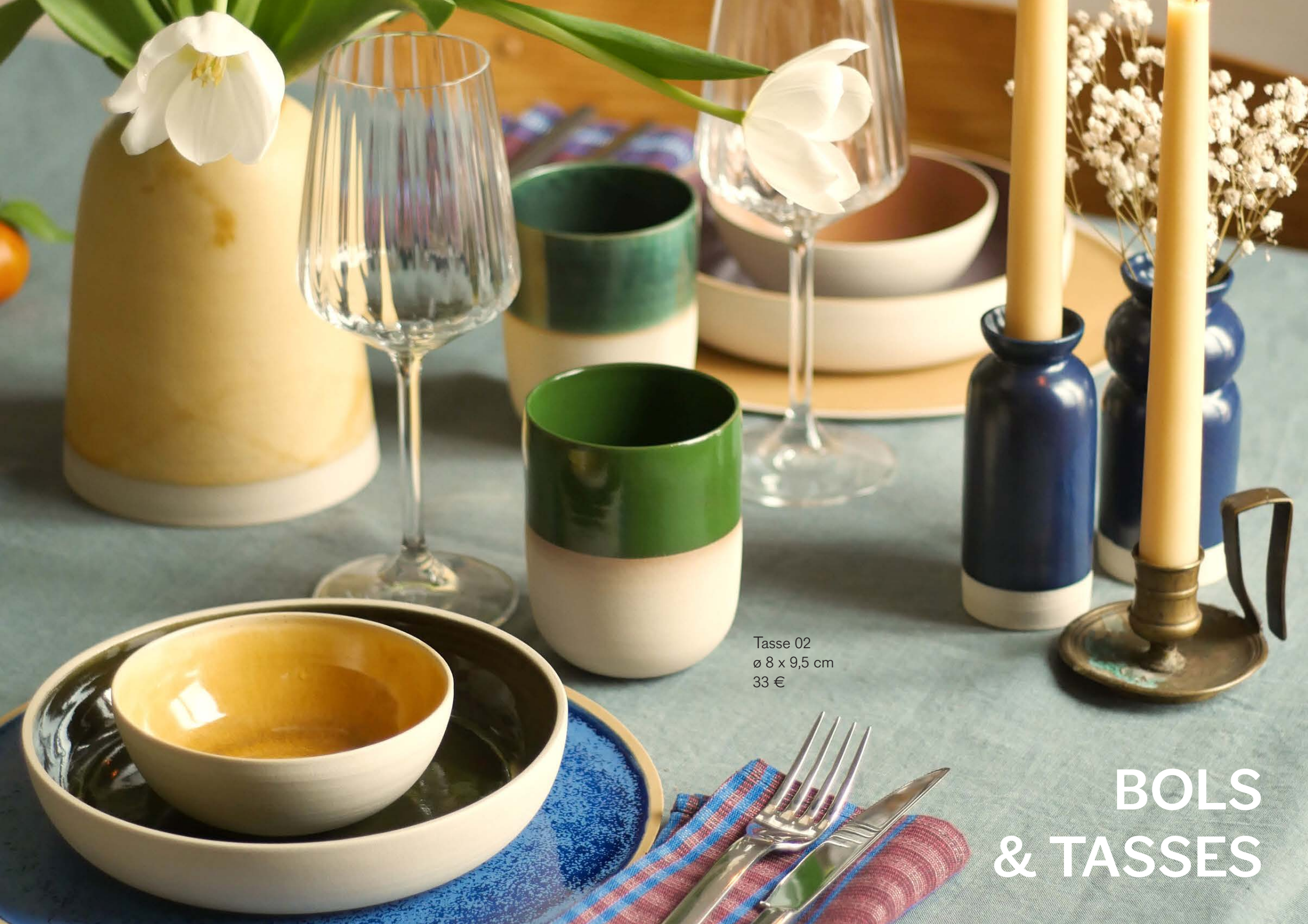
Tasse 02 ø 8 x 9,5 cm 33 €