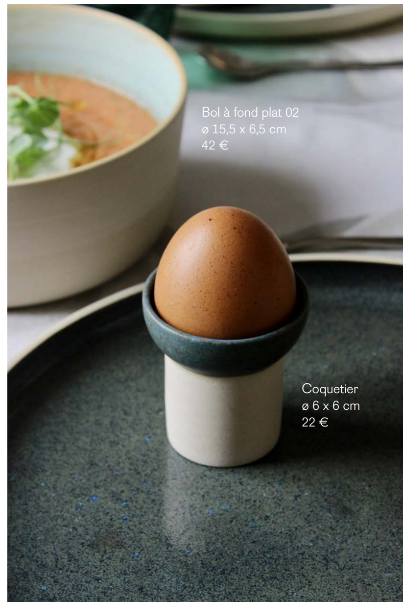
Bol à fond plat 02 ø 15,5 x 6,5 cm 42 €