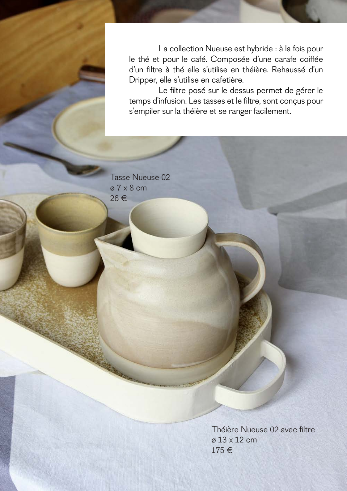
Tasse Nueuse 02 ø 7 x 8 cm 26 €

Le filtre posé sur le dessus permet de gérer le temps d'infusion. Les tasses et le filtre, sont conçus pour s'empiler sur la théière et se ranger facilement.