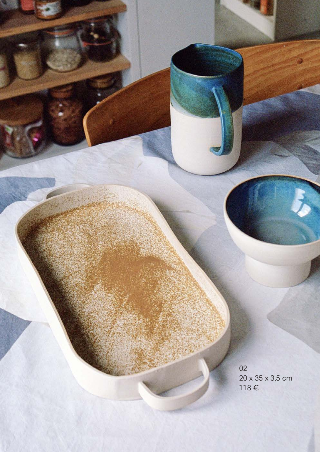
02 20 x 35 x 3,5 cm 118 €