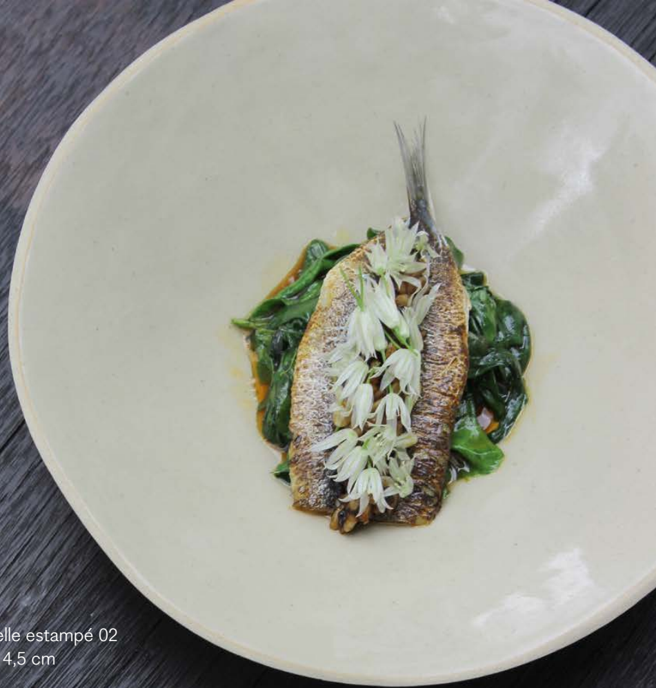
Coupelle estampé 02 ø 21 x 4,5 cm 42 €